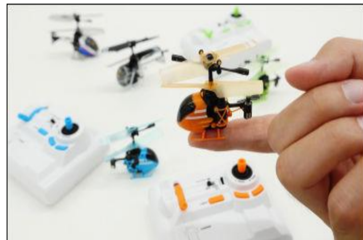
ラジコン ヘリコプター